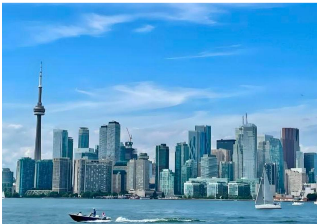
加拿大多伦多市中心

加拿大属于资本主义发达国家，是世界七大工业国之一，经济发达，主要产业包括能源、矿产、林业、农业和高科技。这里以友好、尊重和高度的社会福利体系而著称，国民生活质量位居全球前列。加拿大人热爱冰雪运动，尤其是冰球，它被视为国民运动。